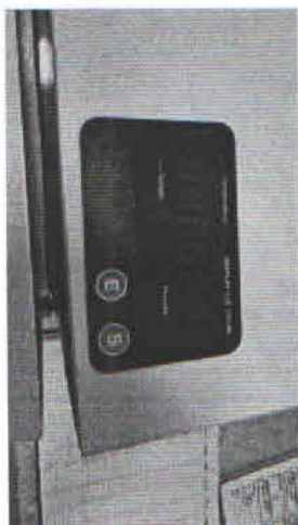
MEMBRANA AUTOCLAVE.jpeg ~178 KB