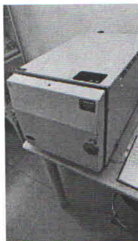
AUTOCLAVE FOTO.jpeg ~108 KB